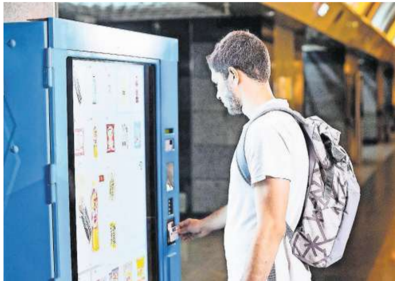
Ein Snackautomat mit Touchscreen-Oberfläche von Invenda aus Alpnach. Das Start-up, das zunächst in Luzern stationiert war, konnte im vergangenen Jahr das grösste Investment in Obwalden abschliessen.

2021 sind 376,5 Millionen Franken in Zentralschweizer Start-ups investiert worden. Ernährung, Gesundheit und Informatik locken Geld an.