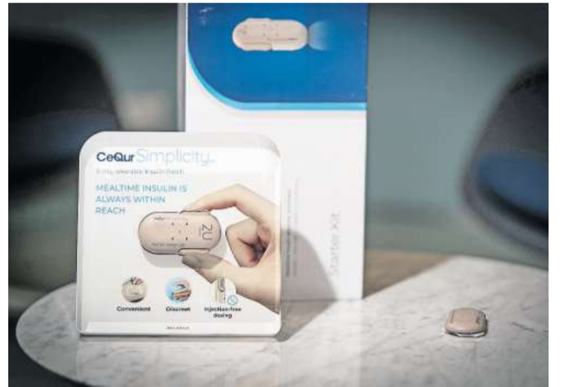
Cequur hat eine tragbare Insulinpumpe entwickelt. Das Start-up mit Hauptsitz in Horw konnte letztes Jahr die mit Abstand grösste Finanzierungsrunde der Zentralschweiz abschliessen. Bild: Pius Amrein (28. April 2021)